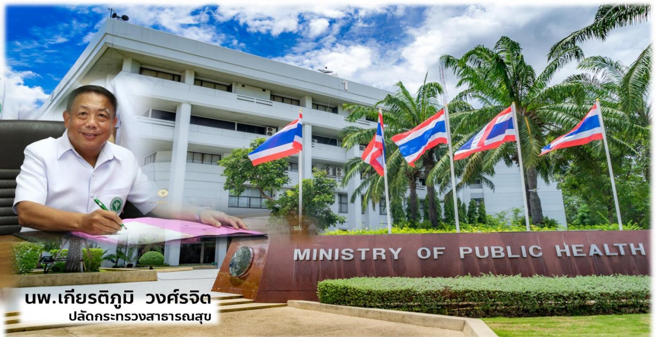
นพ.เกียรติภูมิ วงศ์รจิต ปลัดกระทรวงสาธารณสุข